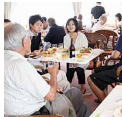
恩師や友人と楽しいひととき