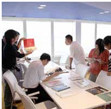
昔の大学案内を見ながら