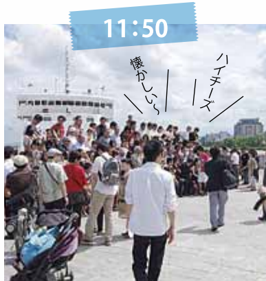
150人で、集合写真撮影