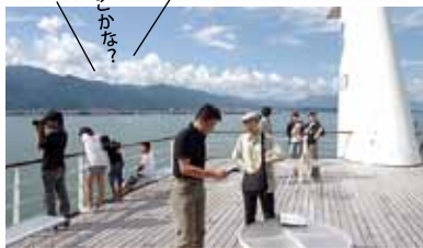
広がる湖西の風景