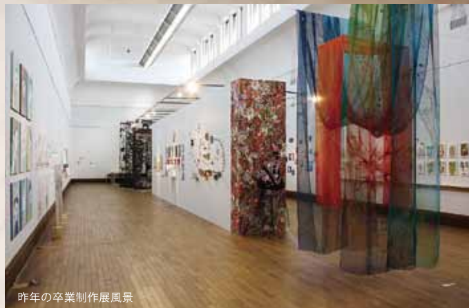
昨年の卒業制作展風景