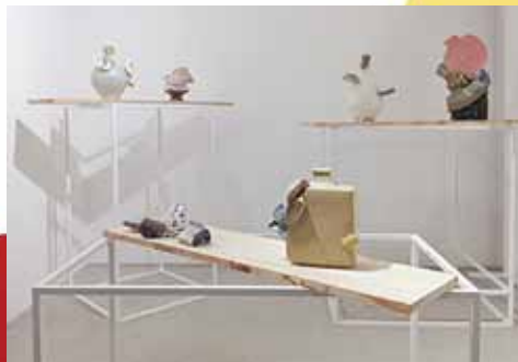
成安造形大学での展覧会「FORM」展 廃棄された陶片を使用した作品