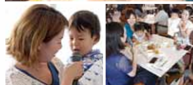
お子様・ご家族紹介