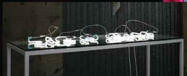
《Untitled (Abstra 1)》

しかし、ネオンサインを使った制作は、働いている環境がそのまま自分のスタジオの様に使う事ができるので、たいへん助かっています。考え方によりますが、私の場合、制作において働いている環境での技術的な側面が作品を構想する時に自分の思考とうまく繋がっている様に感じます。いろいろな苦労はありますが生活と作家活動が無理なく出来ています。