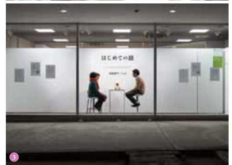
1, 2, 3写真