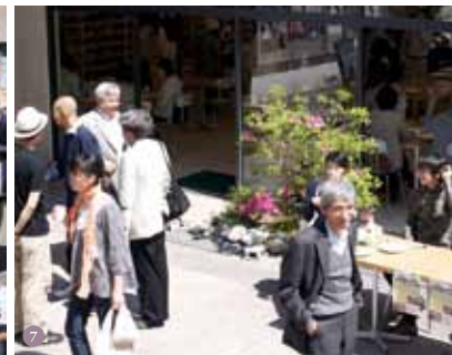
1 | ウェルカムレセプション(メイン会場 コトコト食堂) 2 | ホームタウンバザール(仰木ふれあい青空市) 3 | 先輩と話そう! 卒業生トークイベント 4 | キッズホーム 5 | ホームタウンサミット 第1部 6 | 学生参加企画 成安フリーマーケット2014 7 | 広がる交流(メイン会場 コトコト食堂前)