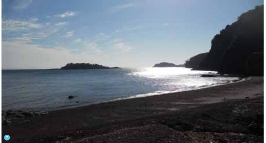
1 | 藤松家正面。左側は京都成安女子学園創立者生家と刻まれた石碑。 2 | 藤松家全景。 3・4 | 美しく整備されている藤松家内部。 5 | 藤松家の裏庭付近。当時はこの後方に専用の船着場があった。 6 | 藤松家に続く緩やかな坂道。 7 | 美しい小値賀島の海岸。