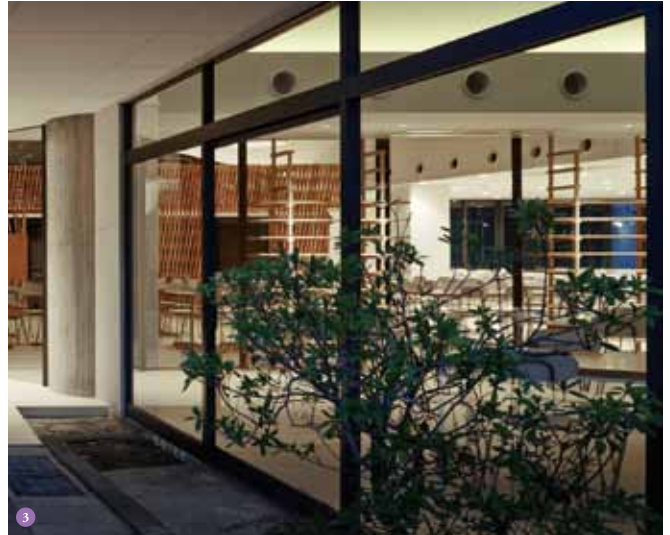
3写真 | ©浅野 豪