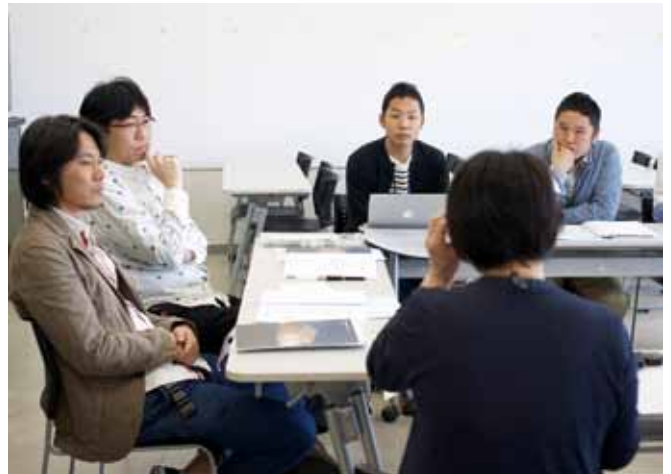
平成26年5月17日(土) 役員会(総会)の様子